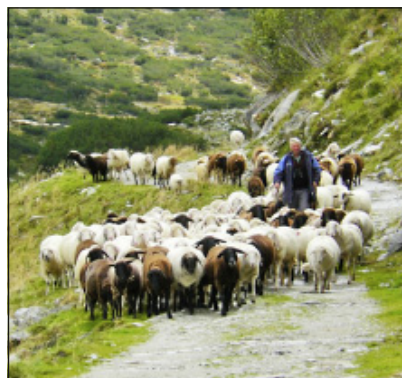
Schafabtrieb in Kärnten