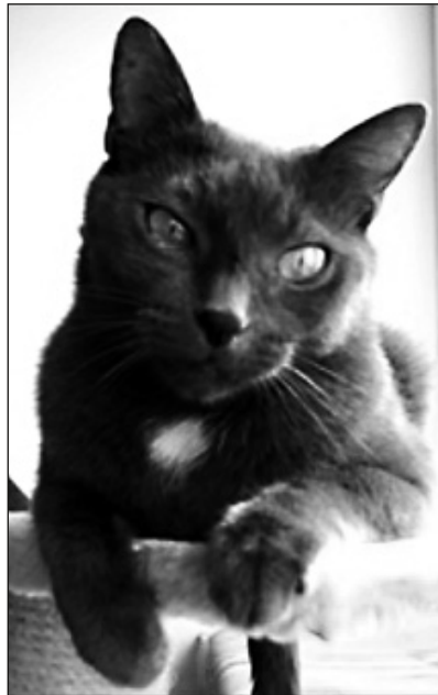
Jessy – das Vereinslogo